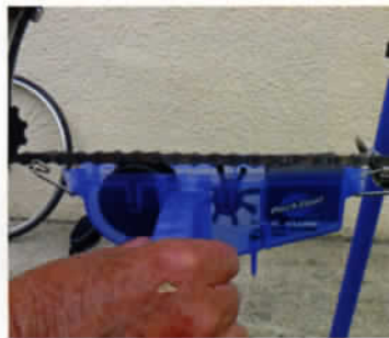
Les trois solutions.