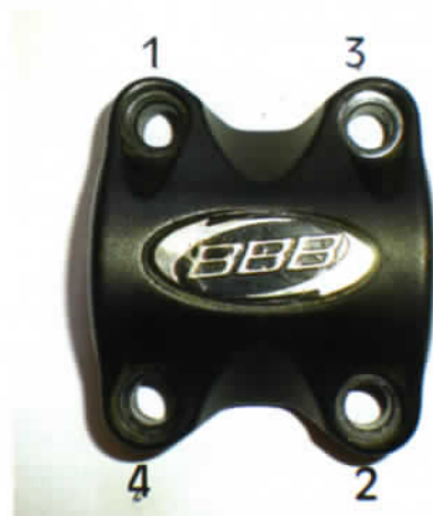
Ordre de serrage des vis de capot.

Voici la liste des principaux points : le capot de potence et le serrage de la potence sur le tube de direction ; le serrage du tube de selle et celui de la selle sur le tube ; les poignées sur le cintre ; le maintien des plateaux, surtout s'ils ont été démontés.